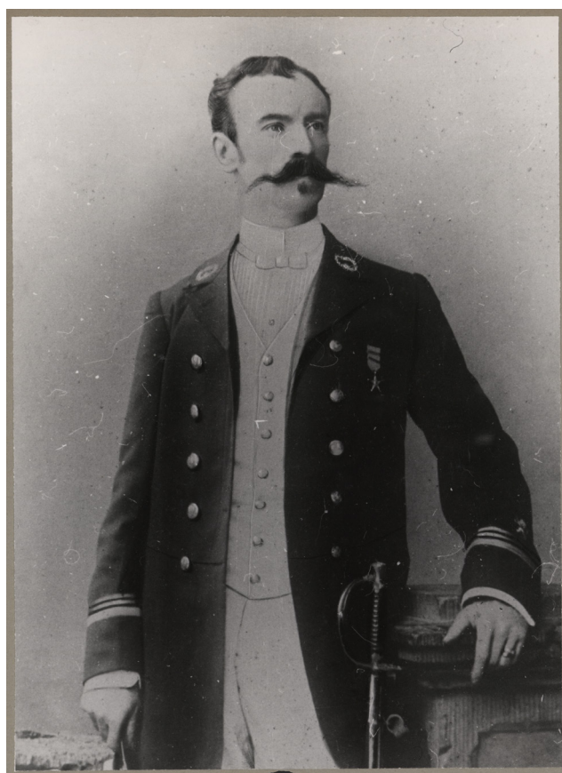
Portret van Léon Rom

Het is onduidelijk of Rom dit document in de context van dit gewelddadige conflict meenam of overhandigd kreeg. Hij hield het bij als 'souvenir' aan een verslagen vijand, wat erop zou kunnen wijzen dat hij de brief als een trofee beschouwde. Rumaliza, die zich herhaaldelijk verzette tegen de installatie van Duitse en Belgische strijdkrachten in de Tanganyika-regio, wist de verschillende aanvallen echter te overleven en te ontsnappen - in tegenstelling tot veel van zijn gelijken. Uiteindelijk vestigde hij zich op Zanzibar, waar hij zijn handelsactiviteiten voortzette.