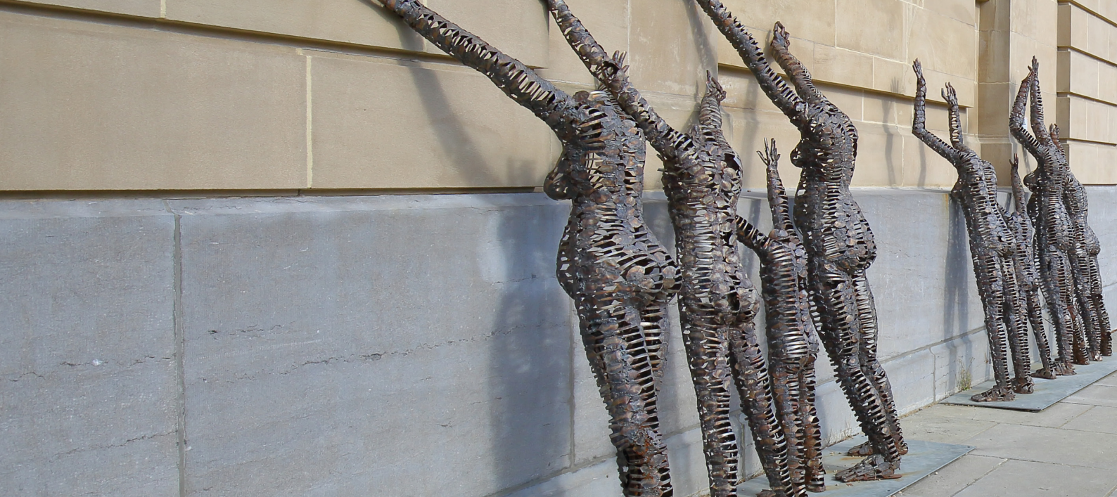
Freddy Tsimba (1967), Centres fermés, rêves ouverts (Gesloten centra, open dromen), Tervuren, 2016. Betonijzer van de werf in Tervuren en lepels uit Kinshasa